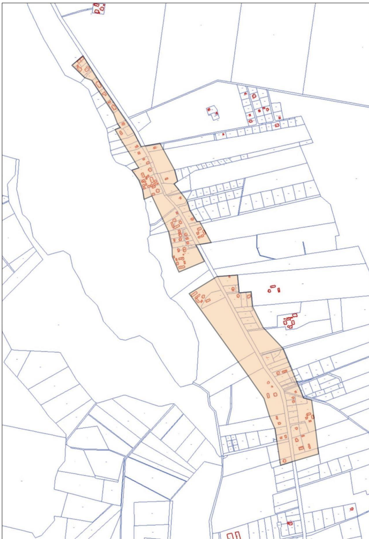
OBSZAR ZWARTEJ ZABUDOWY WSI skala 1:10000